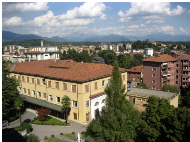
Istituto Scolastico "Cardinal Ferrari" -

Il CALENDARIO SCOLASTICO con le relative festività viene organizzato tenendo conto delle esigenze delle famiglie e del territorio e viene reso noto con la pubblicazione nel sito della scuola e la capillare informazione alle famiglie.